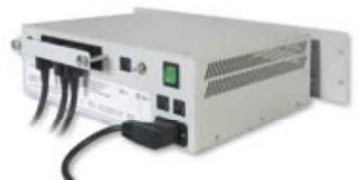
ALN/ ALE mit montierter Abzugssicherung auf Ausgangsgerätesteckern - vorbereitet mit 3HE-Frontplatte zum Einbau in 19"-Schränke

Durch die besondere Ausführung des integrierten Netzeingangsteckers wird die Verwendung beliebiger Anschlussleitungen unterbunden (passende Leitung im Lieferumfang enthalten).